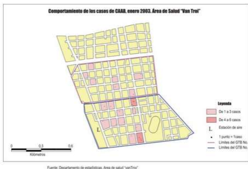
FIG. 2. Comportamiento de los casos de CAAB. Enero, 2003. Área de salud "Van troi".

con el porcentaje de trasgresión de la norma para los contaminantes, las partículas excedieron la norma en un 75 %, y el NO 2 en un 33,3.