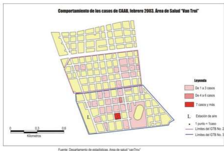
FIG. 4. Comportamiento de los casos de CAAB. Febrero, 2003. Área de salud "Van Troi".