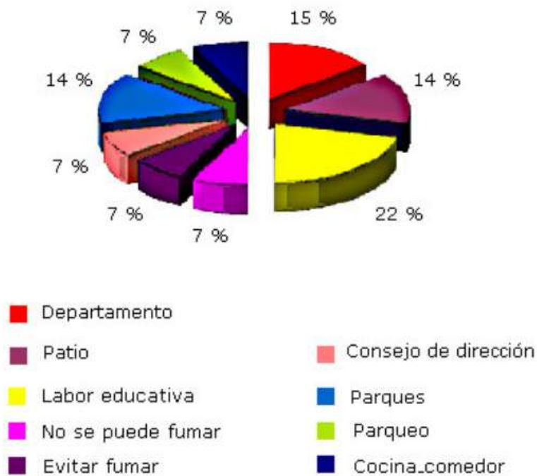
Fig. 2. Distribución según respuestas acerca de espacios libres de humo.

A pesar de que el 56 % de los encuestados refieren trabajar en la creación de las secciones contra el tabaquismo en los centros de salud, solo el 22 % respondió de forma correcta acerca de sus integrantes; el resto de las respuestas fueron incorrectas ( fig. 3 ).