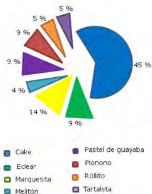
Fig. 3. Distribución de productos de repostería por tipo de elaboración. La Habana, 2006-2010.