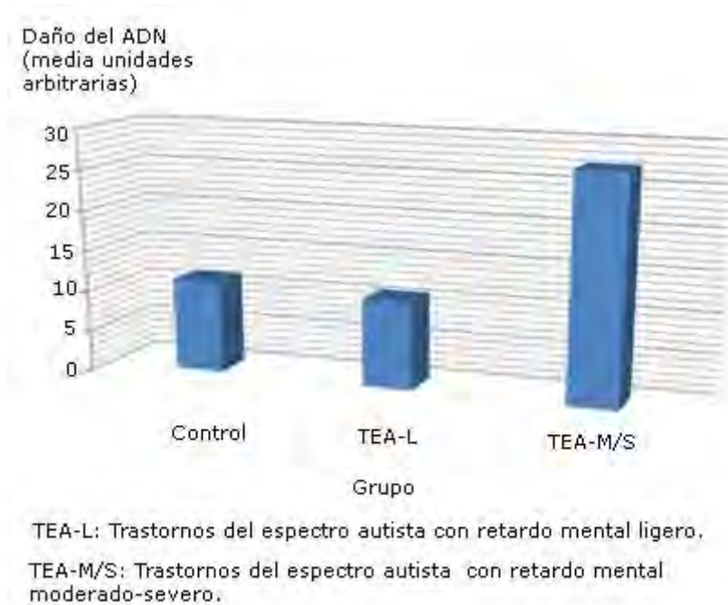
Fig. 2. Niveles del daño del ADN en pacientes con trastornos del espectro autista con diferentes grados de severidad.